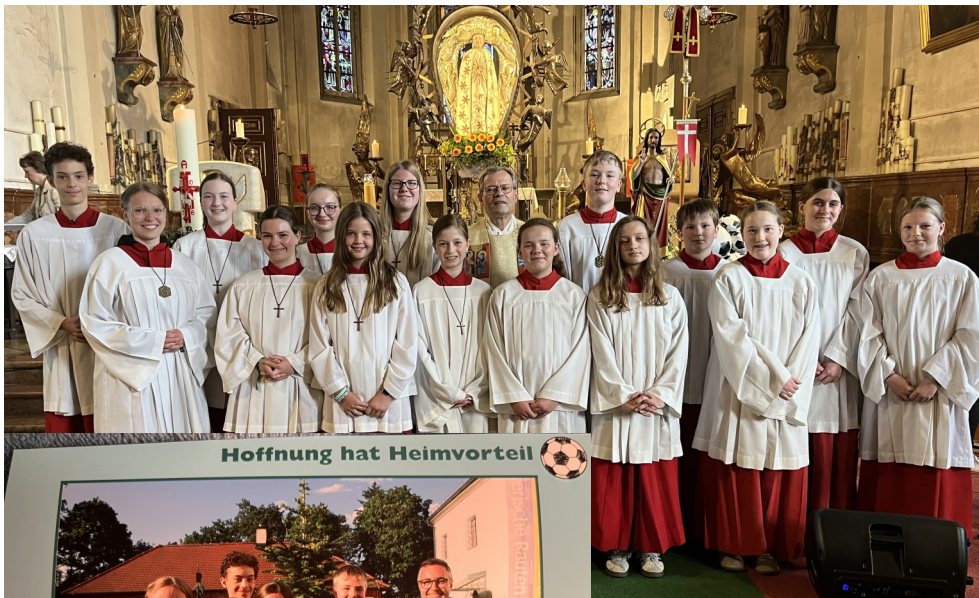
Hoffnung hat Heimvorteil