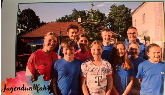
09. Mai 2026